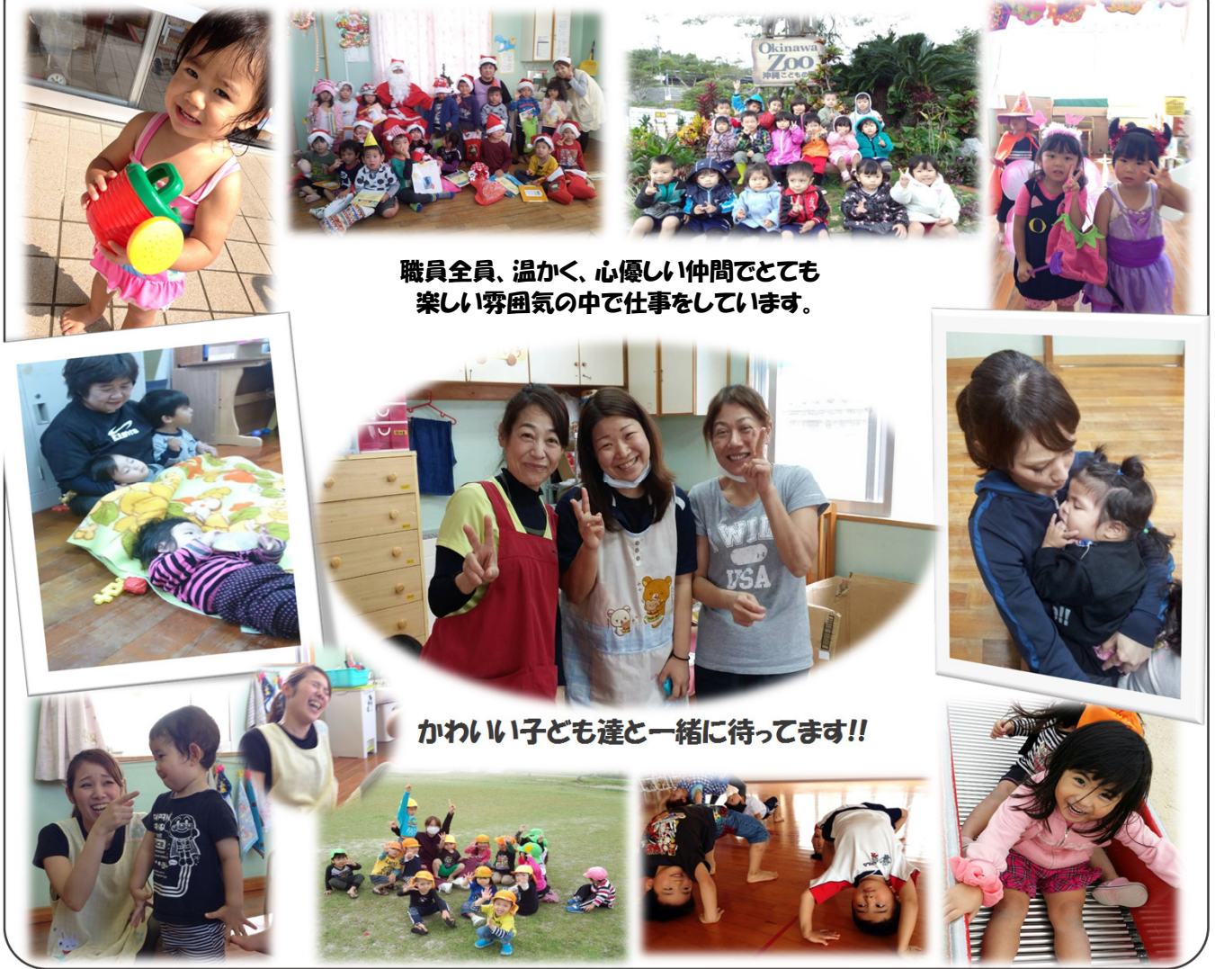
職員全員、温かく、心優しい仲間ととても楽しい雰囲気の中で仕事をしています。