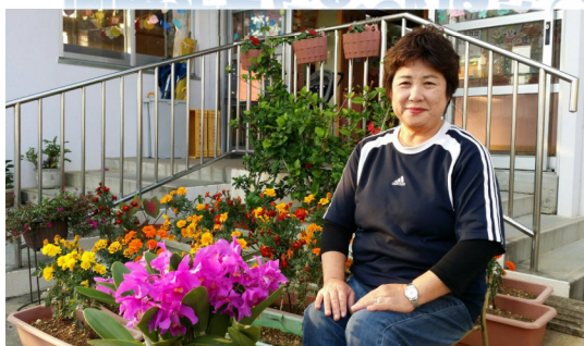
いつもパワフルでユーモアたっぷりの園長先生♪