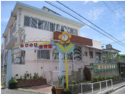
* 平成30年4月・分園開園予定 *