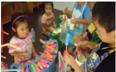
お店屋さんごっこ