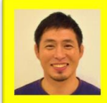
KIDSバランス ※専任講師

Kidsバランスとは「体力」を基本とし体幹を鍛えるトレーニングを通して「生きる力」を育てます