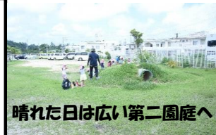
晴れた日は広い第二園庭へ♪

保育園に登園して生活のリズムがリセットではありません。一人ひとりの生活のリズムの中で、子ども達が毎日楽しめる環境で保育を行っています。