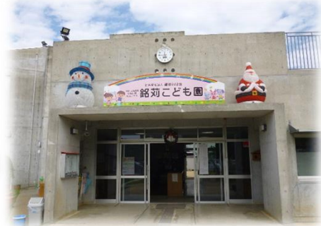
銘苺小学校敷地内 (旧 銘苺幼稚園)