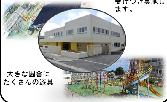
大きな園舎に たくさんの遊具