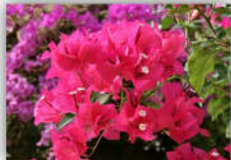
今月の花 ☆ブーゲンビレア 花言葉・・・情熱