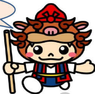
やえせのシーちゃん