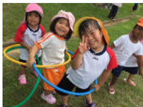
近くの公園でフラフープ遊び