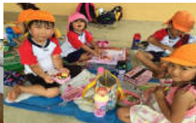
子ども達にとって 大好きな時間です。