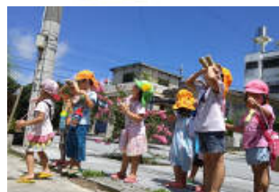
手作りの望遠鏡で探検に・・・