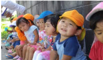
お散歩途中…黒糖を一口。

自然と親しむことで、子どもの感性を磨き、優しく思いやりのある子に育つよう関わっています。