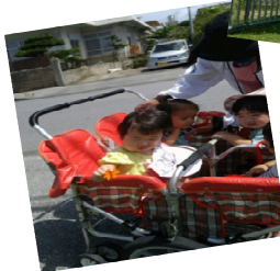
天気の良い日は お外へ散歩に・・・