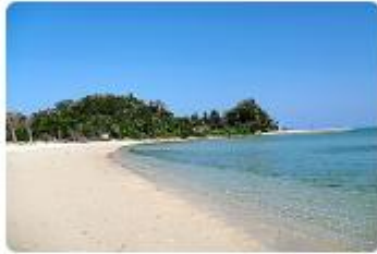
株式会社屋我ビーチセンター