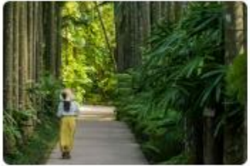
株式会社東南植物楽園