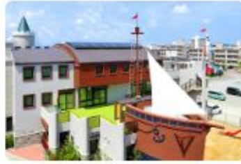
社会福祉法人タピック