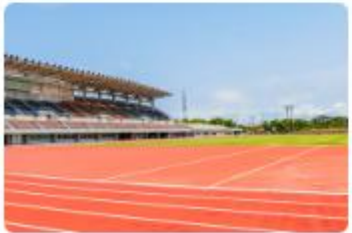
沖縄文化スポーツイノベーション株式会社