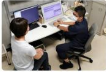
特定非営利活動法人国際リハビリテーションスポーツ振興協会