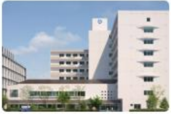
医療法人タピック