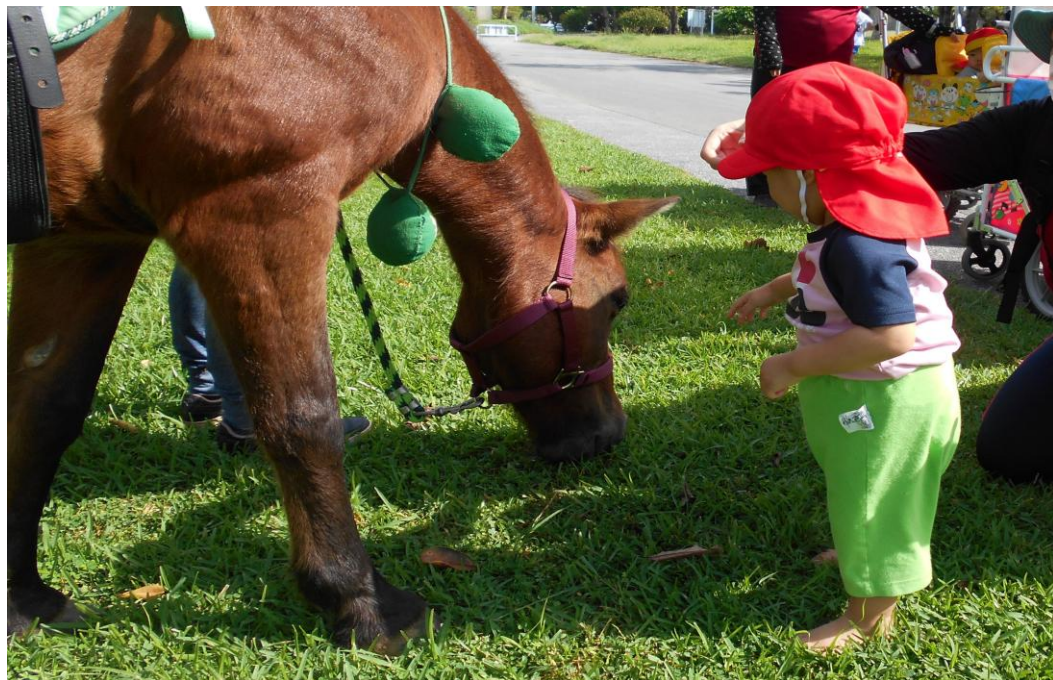
ヨナグニ馬とのふれあい (県総合運動公園にて)