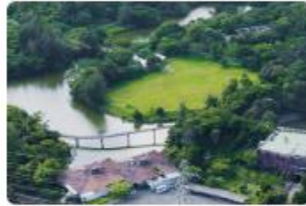
名護自然動植物公園株式会社