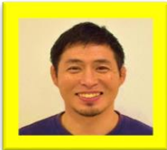
KIDSバランス ※専任講師

Kidsバランスとは「体力」を基本とし体幹を鍛えるトレーニングを通して「生きる力」を育てま