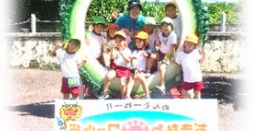
バスに乗って園外保育