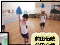
前田伝統 前田の棒