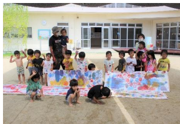
《ボディペインティング》