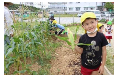
《園庭でトウモロコシ収穫》