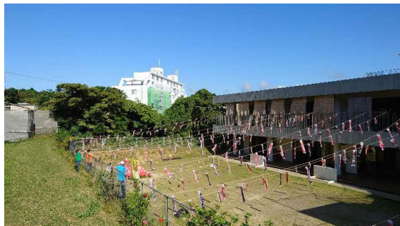
回りを緑で囲まれ、高台に位置する園です。