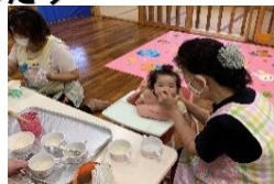
お食事やお風呂の介助等 . . .