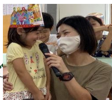
時には司会をしたり