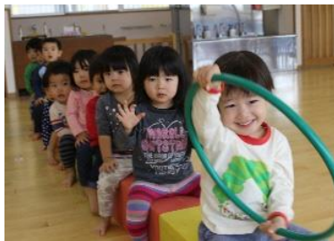
《週に一回のリトミック》↑ ↓《3歳児からの和太鼓!》