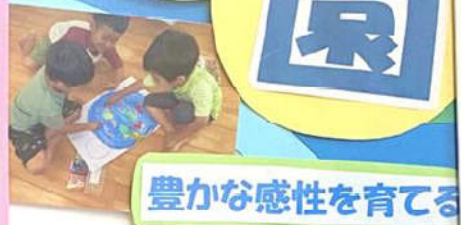
豊かな感性を育てる