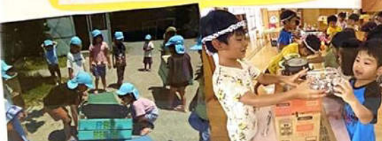
思いやりの心を育てる