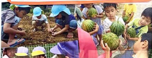
たくましい心と身体を育てる