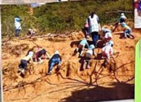
居心地の良い安心できる場所が ここにはあります。

私達は子ども達と、 子ども達を取り囲む人達の 想いを受けとめ、共に支え合いながら、 それを生きる喜びにつなげていきます。