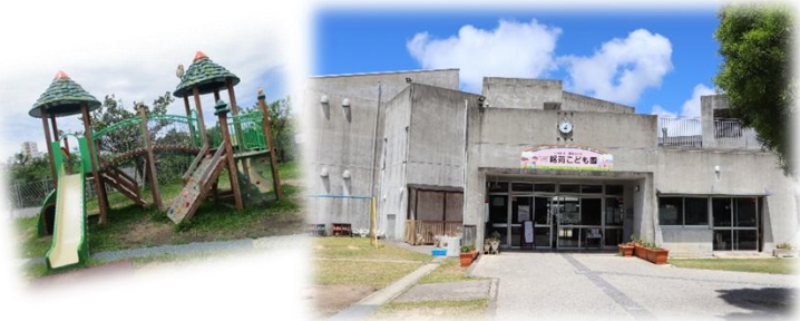
銘苺小学校敷地内（旧 銘苺幼稚園）