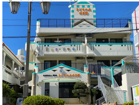
◎ 緑の環境と充実した設備。令和1年9月1日、新園舎竣工。同日に新設認可園として生まれ変わり、6年目を迎えたところです。