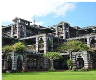
名護市役所マップ