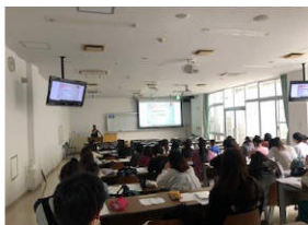
キリスト教短期大学 2年生