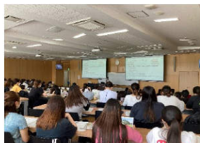
沖縄女子短期大学 2年