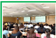
【養成校向けガイダンス】