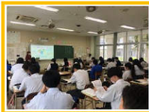
【講座を聞き入る生徒たち】