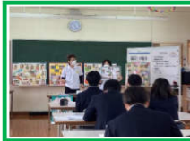
【現役保育士さんによる講話】